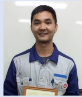
トウイさん (ベトナム)