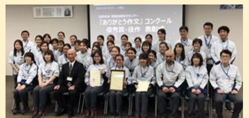
※撮影時のみマスクをはずしております。

「共用部分に私物を置く」トナリトラブル事例 A社実習生は、空室であるし誰にも迷惑はかからないだろうと、隣室の玄関前に自分の荷物を置いていました。大家と入居希望者が部屋の見学で訪れた際に発覚しA社へ連絡、厳重注意を受けました。この行為はベトナムではあまり問題とはならないようで、実習生自身には「悪いことである」という自覚がありませんでした。A社実習生全員に対して注意喚起を行い、当該実習生にはすぐに荷物を撤去させました。